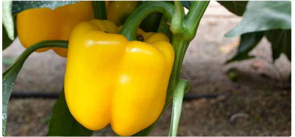
Charanga RZ.

Como el resto de variedades que se encuentran dentro del concepto Lf Defense, Charanga RZ tiene resistencia a oídio, fundamental para los cultivos de hoy en día y para asegurar una producción de calidad al agricultor.