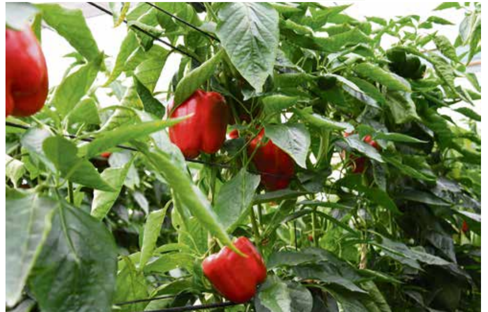
Trovador RZ.