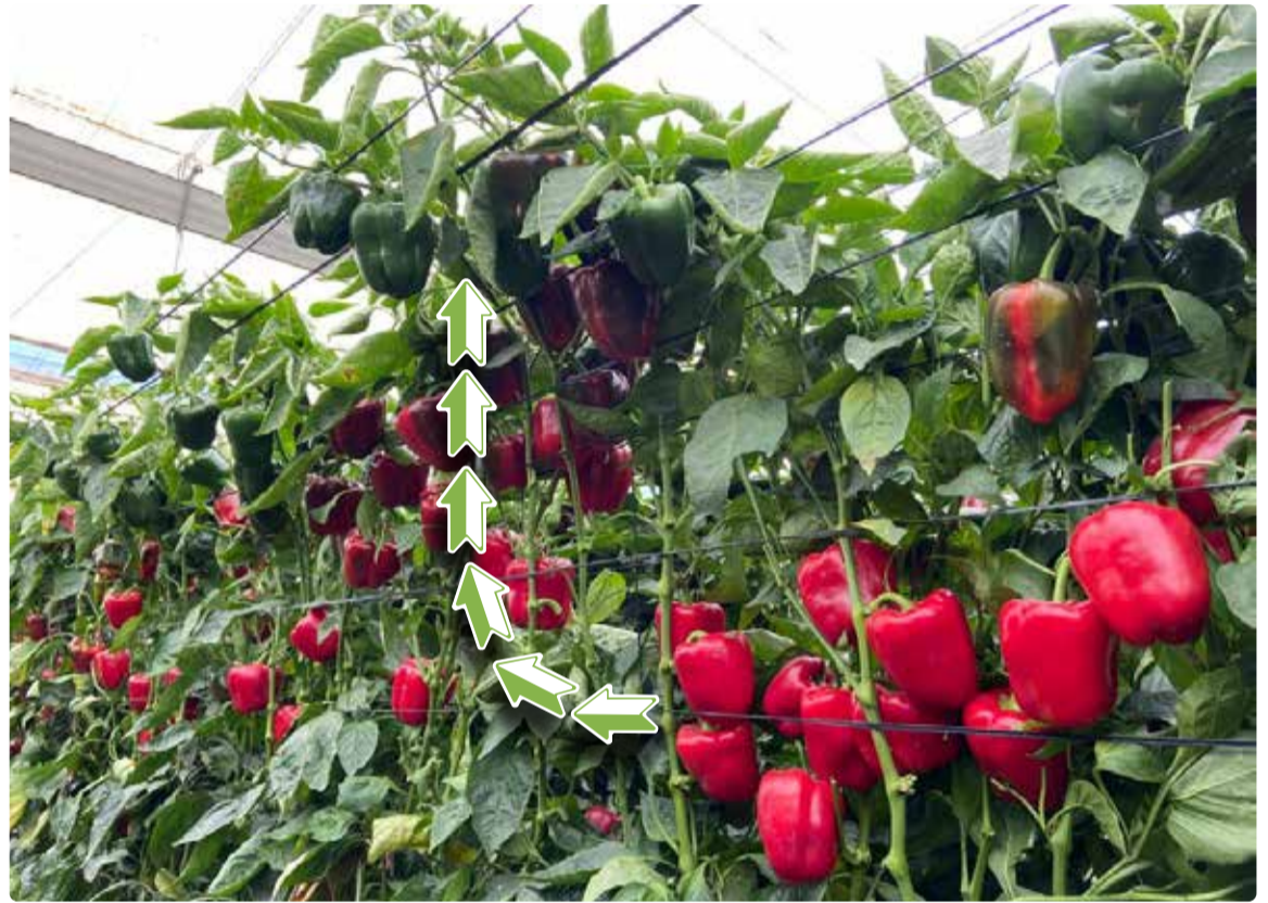
Rebrote de Timbal RZ en los meses de febrero y marzo.

Timbal RZ presenta un completo paquete de resistencias: Tm:0-3; TSWV:0; Lt, esta última resistencia ha demostrado ser una excelente ayuda en este invierno seco en el que el oídio ha dado muchos problemas en los cultivos de pimiento.