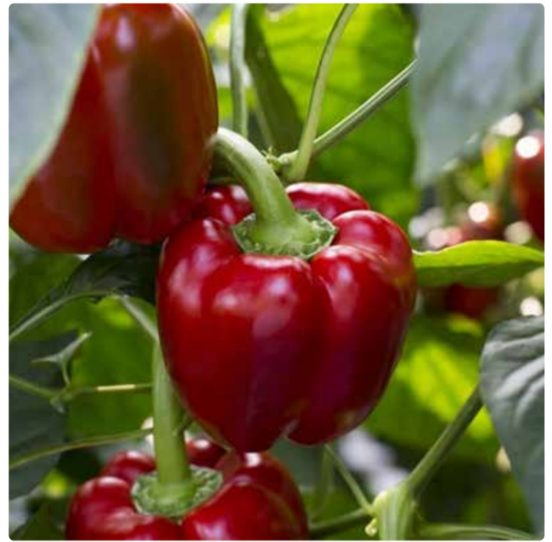
Claque RZ.

Finalmente, cabe destacar que Claque RZ es una gran garantía de éxito en temprano tanto para ciclos cortos, por su gran precocidad de maduración, como para ciclos largos, por su buena calidad de frutos en los frutos de invierno y de primavera.