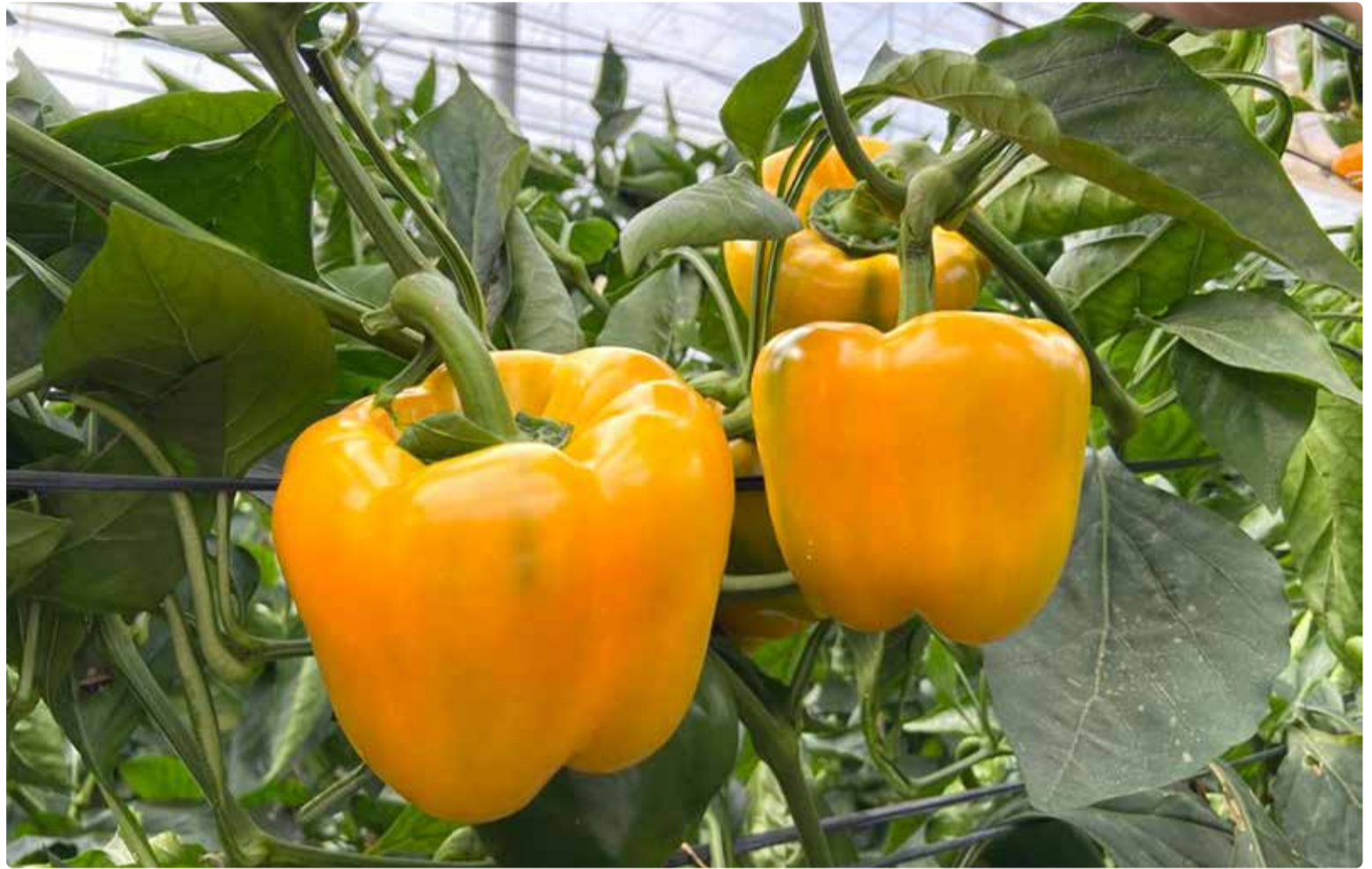
Ritmico RZ. / FOTOGRAFÍAS: ELENA SÁNCHEZ

Asimismo, este material se caracteriza por tener una planta abierta que reduce la cantidad de mano de obra. El fruto destaca por su color amarillo atractivo, junto con el paquete de resistencias Tm:0-3; TSWV:0; Lt. Ritmico RZ lleva tres campañas siendo un producto rentable, que ha demostrado ser un seguro de producción y calidad para el agricultor.