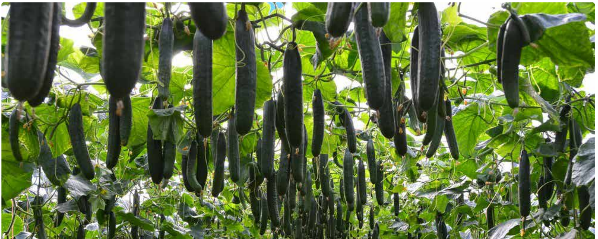
IE. S. G.

es muy balanceada, es decir, “su poder generativo de fruto va muy equilibrado con su poder vegetativo, por lo que le confiere mucha limpieza en el rebrote y permite trabajarla un poco menos”, asegura Javier López.